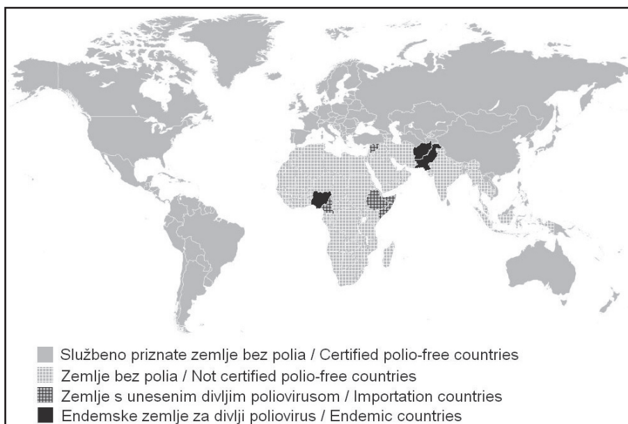
Sl. 2. Rasprostranjenost poliomijelitisa u svijetu u 2013. godini